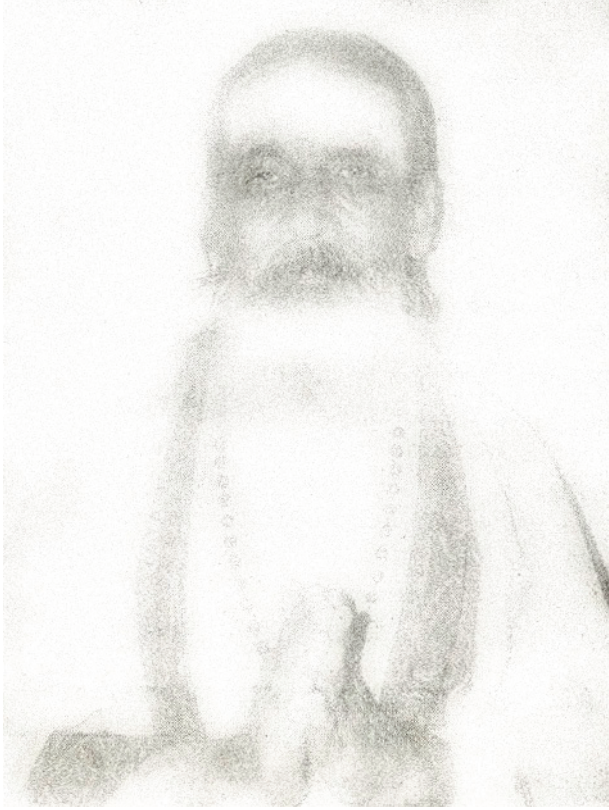
Swami Shuddhananda Bharati