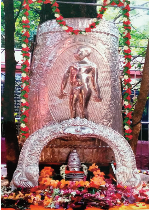
Maha Samadhi de Sri Sadasiva Brahman Swamiji Sri Sadashiva Brahmendrar Adhishtanam, Nerur in Tamil Nadu